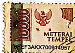
Redemptus Smit Pake Pega NIM: 11121019