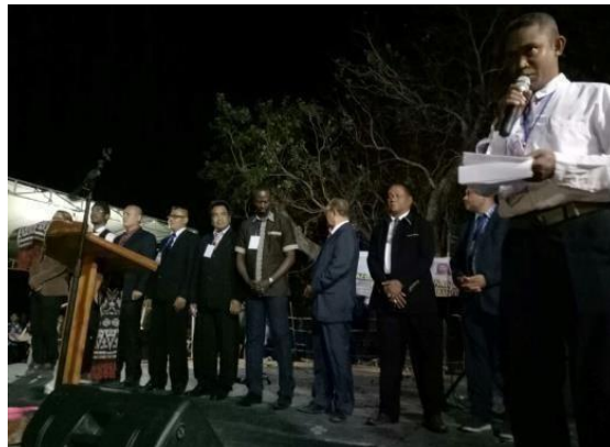
Gambar 2 Kegiatan oekumene dan seminar di kab. Rote Ndao

Berbagai upaya spiritual di dalam Gereja, lingkaran doa, komunitas Kristen, dan bahkan negara telah berkembang sebagai respons terhadap masa lalu ini. Seminar, retret, KPI (Layanan Penyegaran Iman), KKR (Layanan Kebangkitan Rohani), dan acara serupa lainnya telah berkembang selama bertahun-tahun.