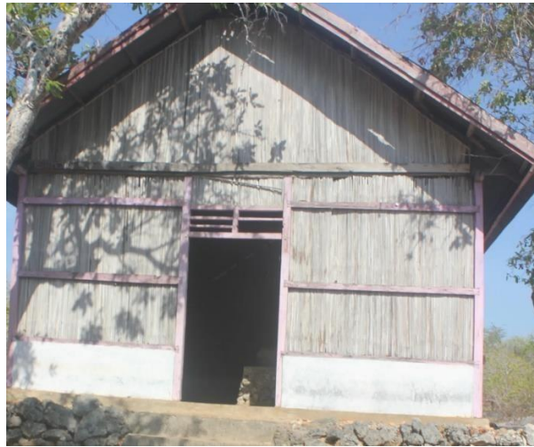
Gambar 1 Rumah gereja di Fiulain

Ndao. Kekristenan pertama kali berkembang dan menyebar di Pulau Rote. Kabar Injil dengan cepat menyebar ke seluruh komunitas, menyentuh setiap kota di Pulau Rote Ndao.