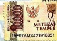
Shintika Nenabu 43119062