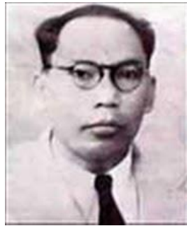
Gambar 1.2 foto Ki Hadjar Hardjo Oetomo