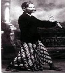
Gambar 1.1 foto Ki Ageng Ngabei Soerjodiwirjo